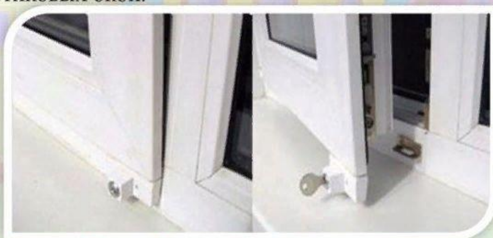
Замок блокировщик с ключом

Можно воспользоваться специальными замками блокираторами, которые предлагают установщики пластиковых окон.